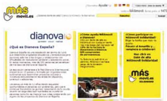
Acuerdo entre Más móvil y Dianova

Dianova y MÁS móvil han firmado un convenio por el cual esta compañía de telefonía low cost líder en España donará el 10% de las facturas de los nuevos clientes que contraten sus líneas o hagan su portabilidad a través de esta web: http://www.masmovil.es/dianova .